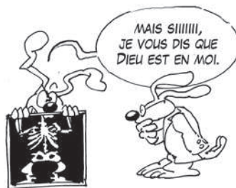
le péché n'existe pas