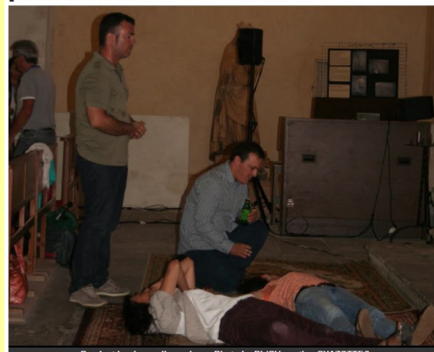
Pendant la séance d'exorcisme.