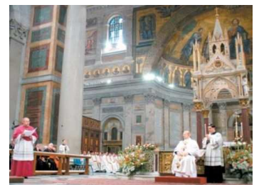
« Notre Père » lors de la messe d'action de grâce en la basilique Saint-Paul-hors-les-murs à Rome pour le soixantième anniversaire de son ordination sacerdotale (2004)