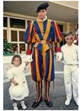
2 des enfants du Fondateur