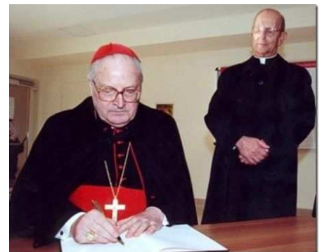
Le cardinal Angelo Sodano, qui était Secrétaire d'Etat au Vatican (1990-2006) et protecteur de Martial Maciel