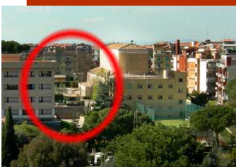
Mausolée construit à Rome par Maciel pour y être enterré