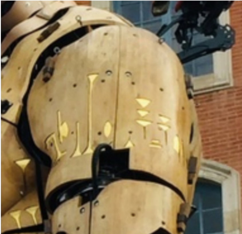
Symboles cunéiformes sur le corps du Minotaure

Comme pour bien des symboles magiques, il y a plusieurs interprétations possibles souvent inversées. Ainsi les trois clous représentent dans le christianisme la crucifixion du Christ, mais dans les rituels magiques, les clous représentent le vœu que l'être, l'objet, ou le lieu soient assujettis à l'idole, ici représentée par le minotaure. Le labyrinthe symbolise dans un espace restreint, le chemin de l'initiation.