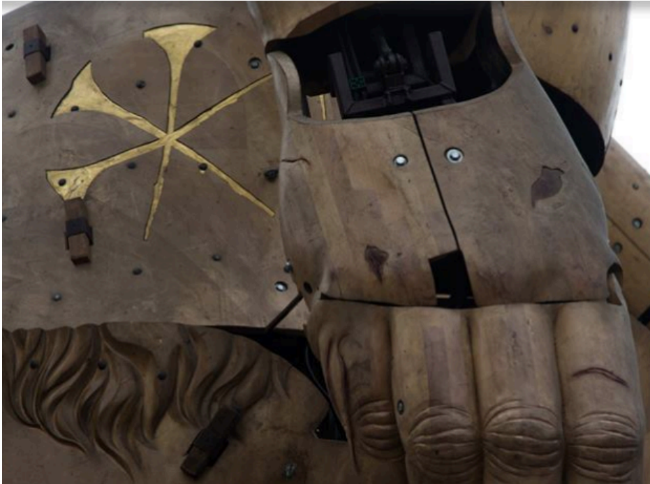
3 clous sur son bassin, 6 clous au total (3 de chaque côté)

On trouve sur le corps du minotaure un labyrinthe, 3 clous, des symboles cunéiformes, le tout fait à la feuille d'or.