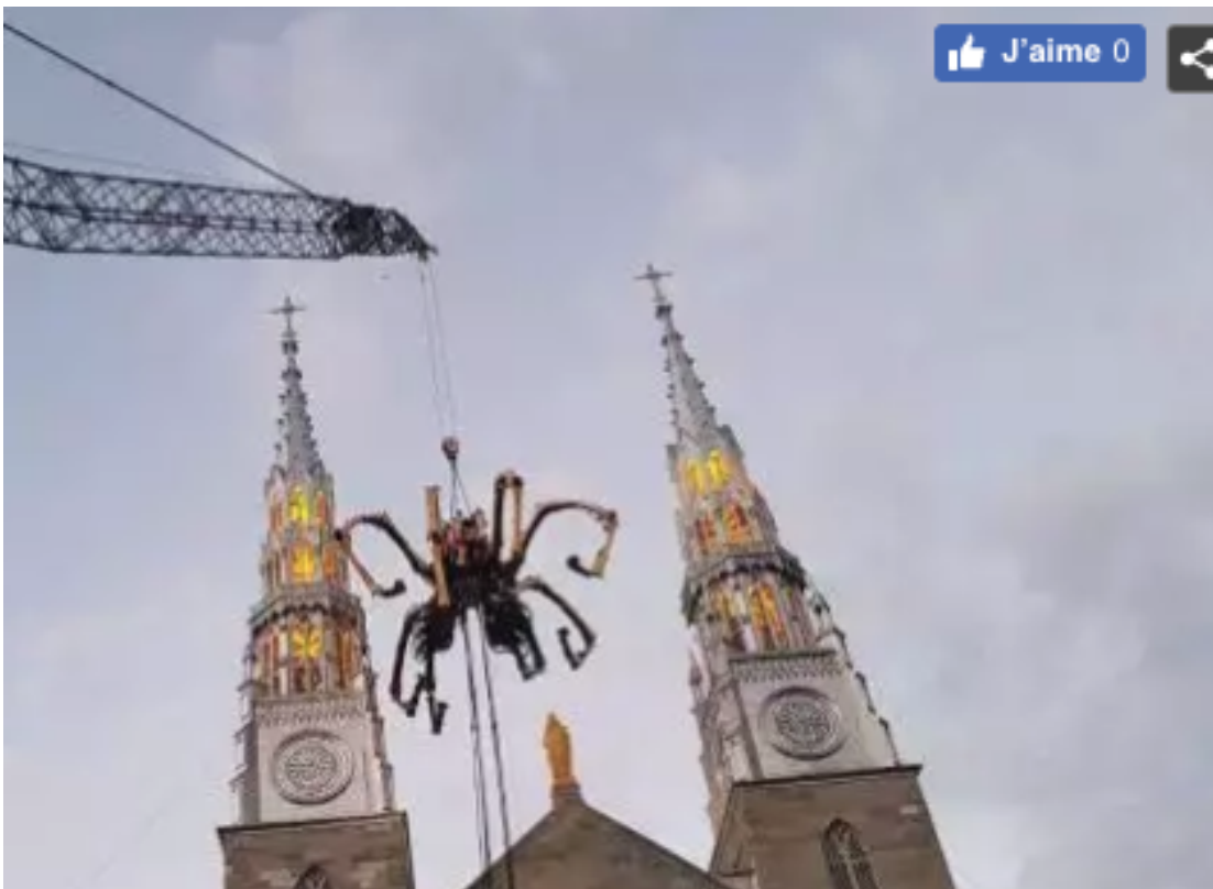
Araignée Kumo sur la cathédrale d'Ottawa