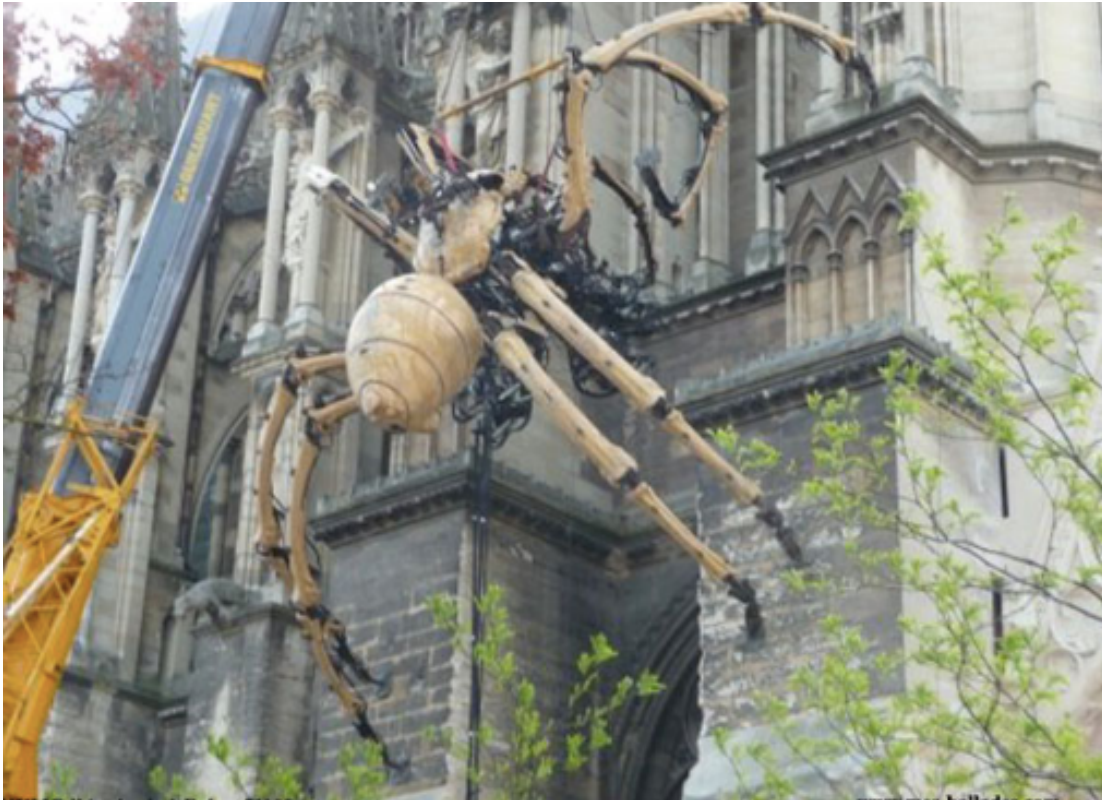
Araignée Kumo qui escalade la Cathédrale de Reims